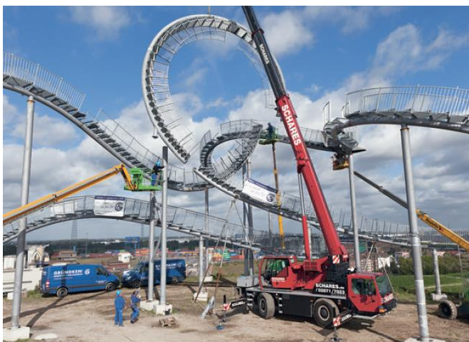
Obr. č. 2 – Montáž konstrukce

Celkové finanční náklady byly kolem 2 milionů Euro a byly financovány prostřednictvím spolkové země Severní Porýní-Vestfálsko a Evropskou Unií v rámci ekologického programu ÖPEL (90%) a zbývajících 10% z prostředků Evropského města kultury RUHR 2010.