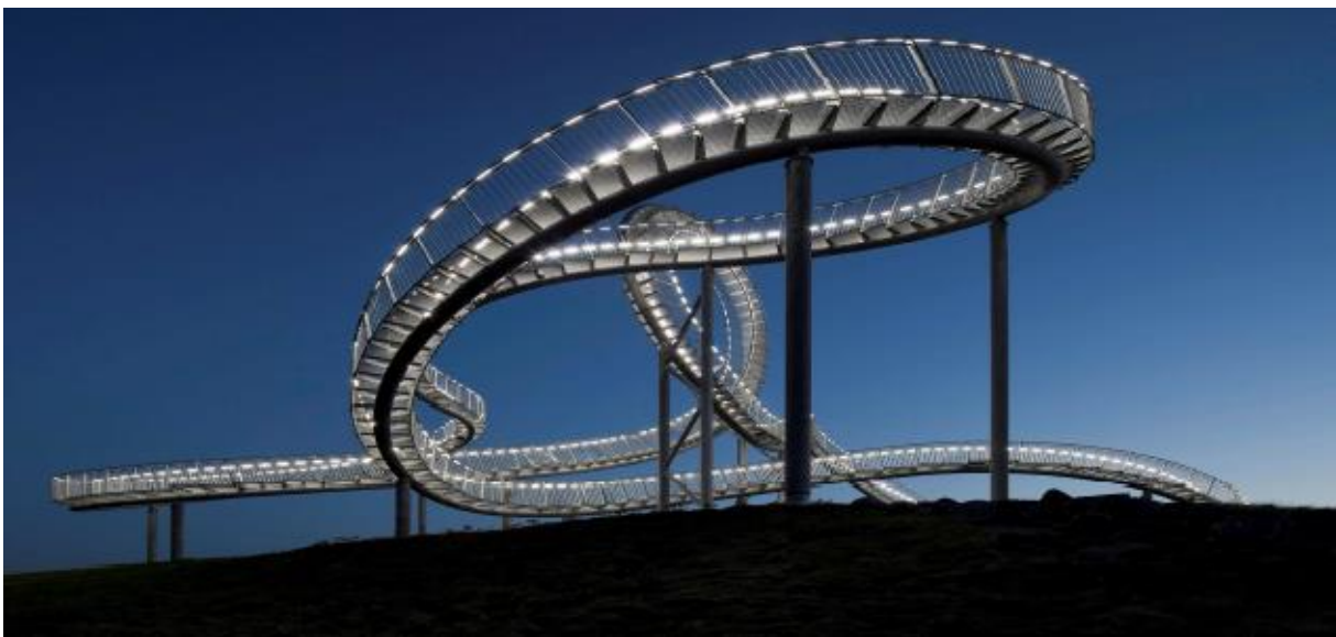
Obr. č. 1 – Tiger & Turtle v noci

V rámci 17. zasedání zahraničních poboček GSI SLV ( 16.-17.10. 2014 v Duisburgu) navštívili účastníci jednání nový symbol umělého návrší v areálu bývalých hutnických provozů - Tiger and Turtle – technický unikát a umělecké dílo v nově zřízené zelené zóně Angerpark. Celá tato oblast je podobně jako u nás Ostravsko velmi průmyslová a zaměřena především na těžký průmysl, v Porúří především hutnictví. Snaha o zlepšení životního prostředí i rekultivaci kdysi velmi poničených lokalit je zřejmá. Jedním z nejvýznamnějších projektů v rámci Evropského města kultury RUHR 2010 bylo vybudování 20 metrů vysoké pochozí konstrukce, která byla mezinárodní porotou vybrána z několika návrhů na osazení vrcholu Heinricha Hildebranda v oblasti Duisburg jih. Zvítězil návrh Heike Mutter a Ulricha Genta. Tato konstrukce svojí formou připomíná horskou dráhu.